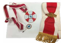
Les 3 ornements remis aux nouveaux membres de la confrérie Saint-Éloi.

Les confréries perpétuent les vertus vécues par saint Éloi et qu'il enseignait : la probité dans le travail, la loyauté dans le conseil et la charité auprès du prochain (dans toutes les œuvres de miséricorde, et en particulier l'accompagnement des familles en deuil). Ce rassemblement à Noyon est donc très heureux et important, pour notre cité