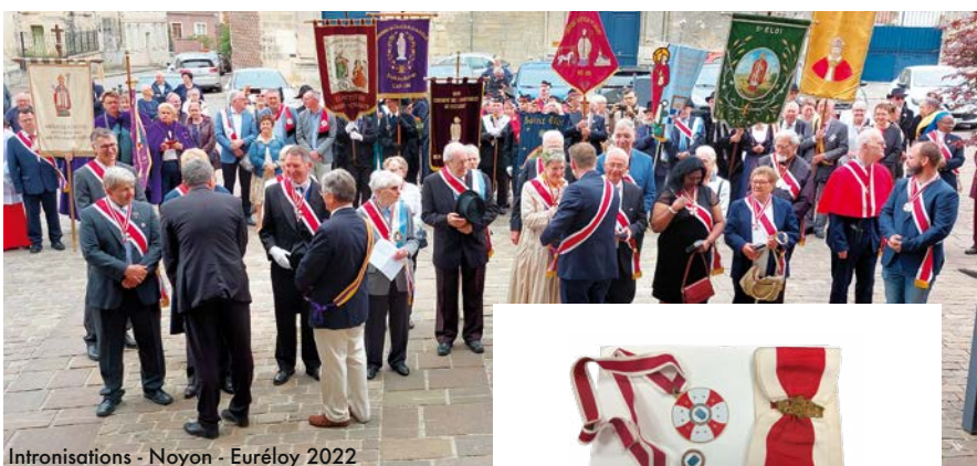
Intronisations - Noyon - Euréloy 2022