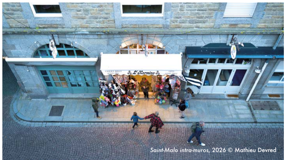
Saint-Malo intra-muros, 2026

D'en haut, tout paraît simple. Des passants, des gestes, une rue ordinaire. Rien ne déborde. Rien ne brûle.