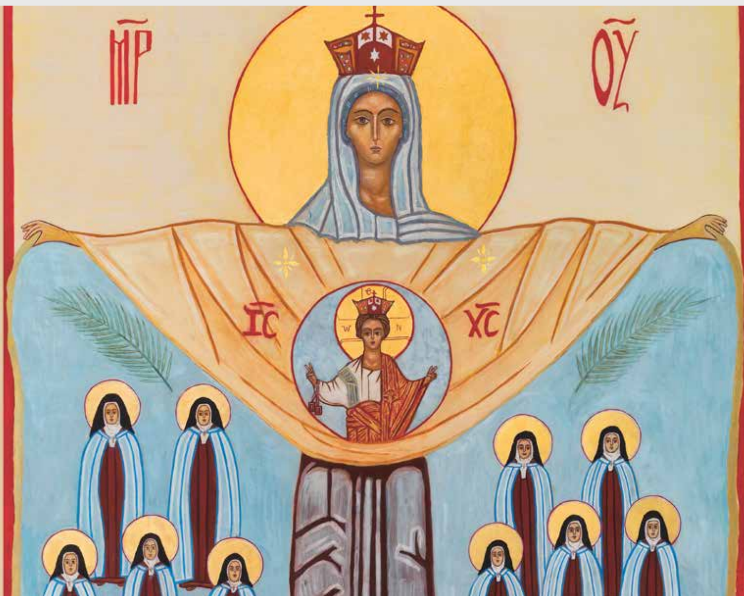
Icône écrite par Muriel Brebion