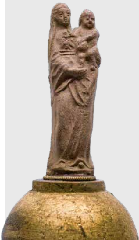
Statuette de la Vierge des martyres

Les saintes Carmélites de Compiègne nous offrent un magnifique exemple d'une sainteté communautaire, couronnée par le martyre. À la suite du Concile Vatican II, notre pape François a beaucoup insisté sur cette dimension communautaire de la sainteté, dans son exhortation apostolique Gaudete et exultate (n. 140-146) et dans son discours du 17 novembre 2023 au Dicastère pour les Causes des saints. Plénitude de la charité comme unique amour de Dieu et du prochain en Jésus, la sainteté chrétienne est en effet inséparablement personnelle et communautaire. Jésus est présent dans le «château intérieur de l'âme», c'est-à-dire en chaque personne qui l'aime (cf. Jn 14, 23), et dans le «château extérieur de la communauté», c'est-à-dire «au milieu» des personnes rassemblées en son Nom (cf. Mt 18, 20). La famille et la communauté chrétienne sont ainsi le lieu de la sainteté.