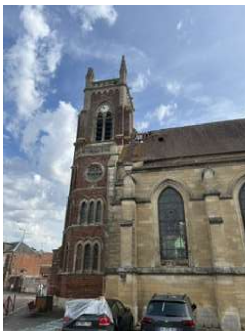
Après le passage de la tornade