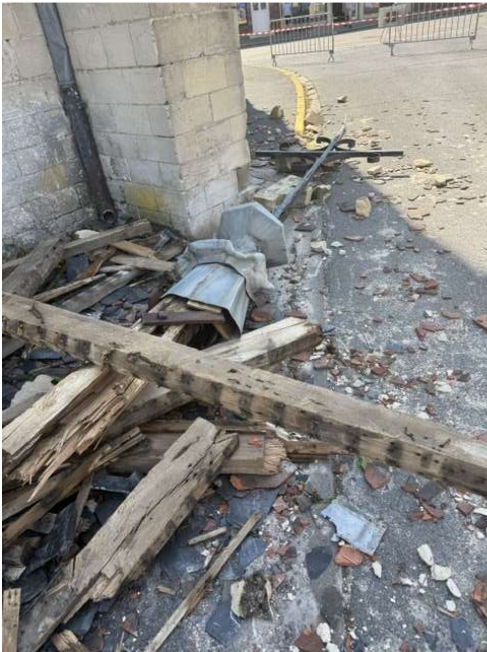
La croix qui était en haut du clocher (cf 1 ère photo)