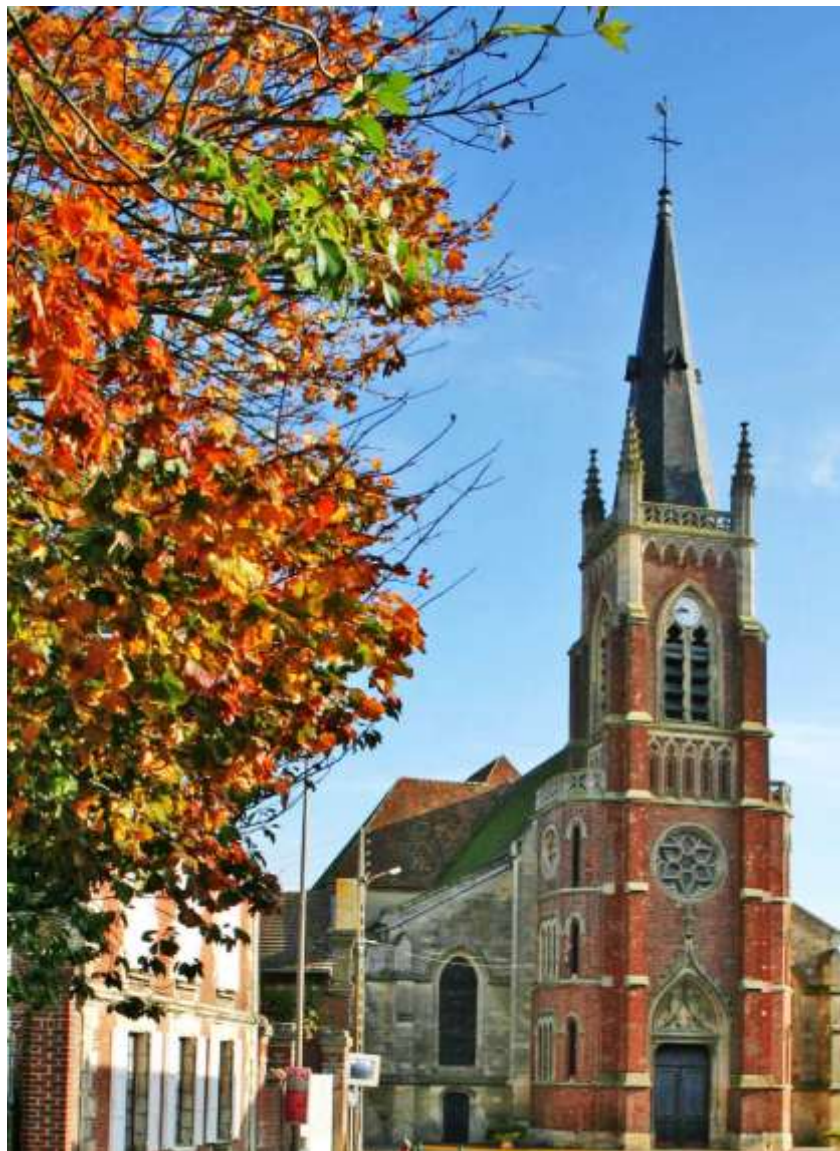
L'église Notre-Dame de l'Assomption à l'automne dernier