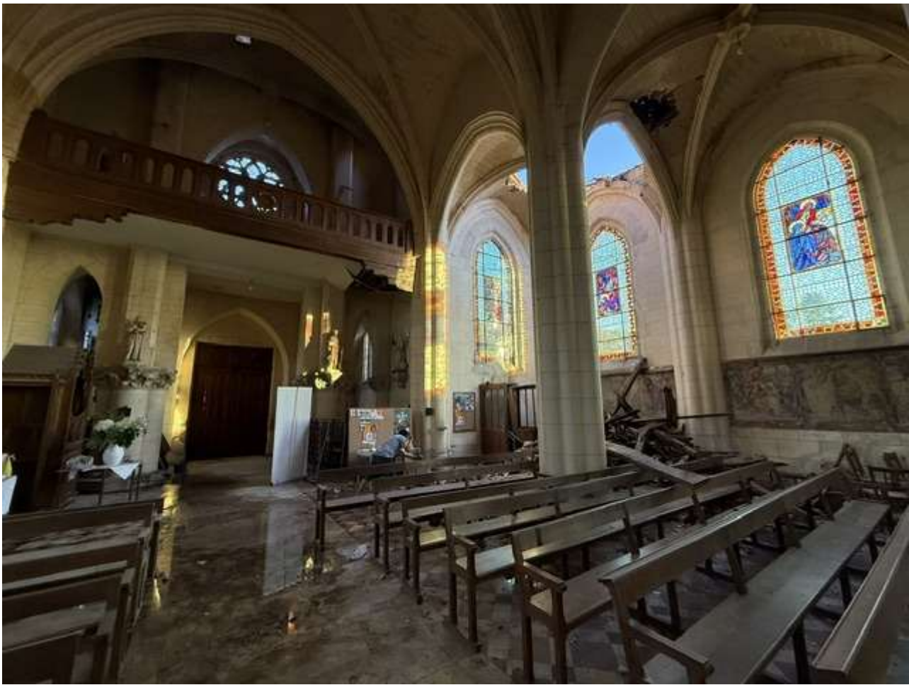
Pour situer où se trouvent principalement les dégâts Sans oublier les vitraux et d'autres parties de la toiture