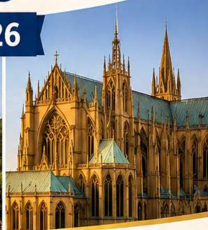
CATHÉDRALE DE METZ