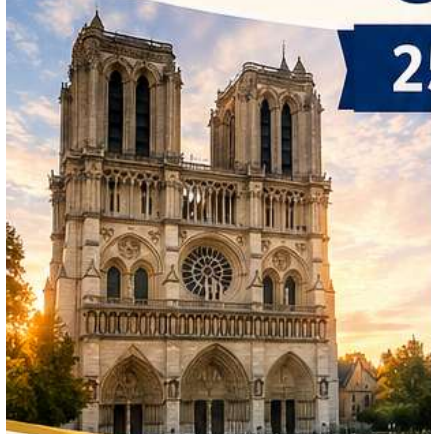
NOTRE-DAME DE PARIS